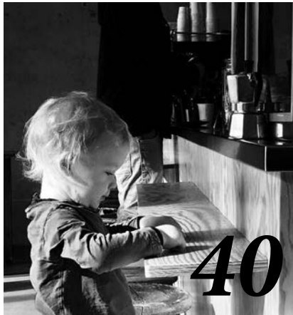
Und dann zersprang die Teekaraffe: Wie ein Unfall das Leben einer Familie veränderte.