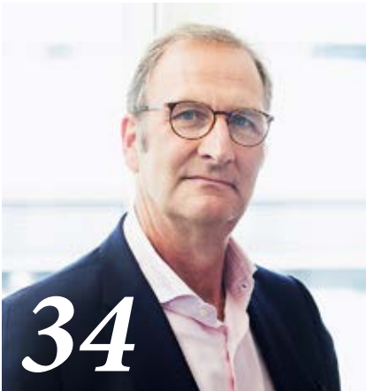
Lutz Jäncke, ist Auswendiglernen überhaupt noch zeitgemäss?