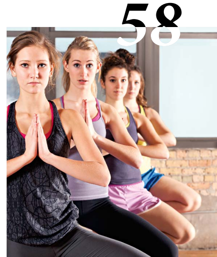
Mit om und Baum zum Glück: Auch Jugendliche mögen Yoga