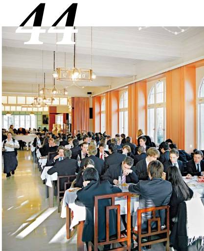
Leben im Internat: eine Starthilfe für Karriere und Charakter oder Strafe der Eltern?