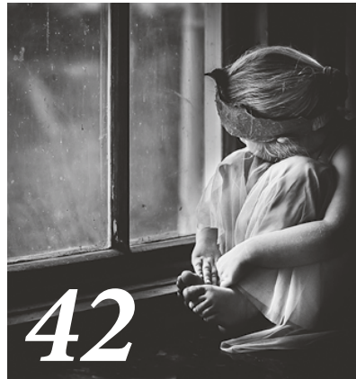
Wie Kinder mit unliebsamen Gefühlen umgehen lernen.