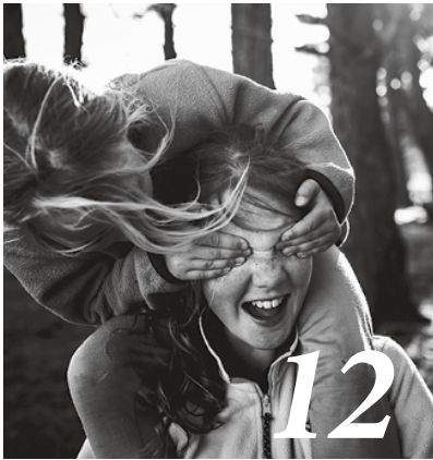
Herbert Renz-Polster beschwichtigt Eltern: Kinder verzeihen Erziehungsfehler.